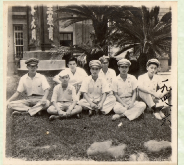
▲1948年與同學於校園一隅合影