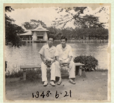
▲1948年與同窗好友於臺中公園湖心亭前合影