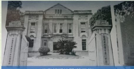
光復初期校門(第二代)