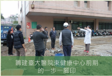
籌建臺大醫院東健康中心前期的一步一腳印

我在到任後，幾乎是立刻就查覺到我面臨了這個困境，也了解之前的經營者的辛酸。更慘的是，竹東醫院已經設立20年，正好也到了整個醫院的建築物從裏到外的各種設