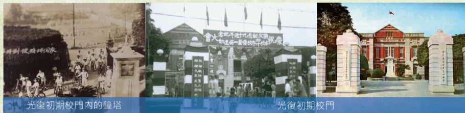
光復初期校門內的鐘塔