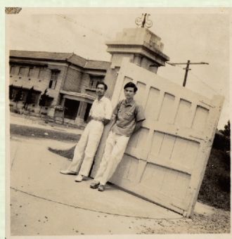
▲1948年靠近學校東北側出入口的側門景觀