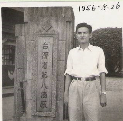
▲1956年初任職臺中酒廠