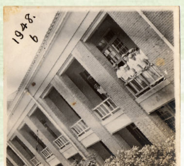
▲1948年於紅樓側翼二樓與同窗合影