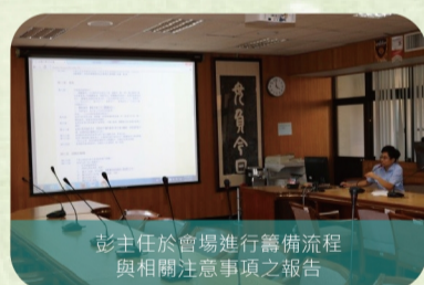
彭主任於會場進行籌備流程與相關注意事項之報告

萬事起頭難！臺中一中走過101年的歷史榮景，持續為國內的高中教育貢獻正向的能量；藉由全國校友總會的成立，凝聚廣大各界校友的力道，相信能夠為下一個100年作足充分的準備。菁英典範、百年風華，母校的優質與卓越，必定能夠在推動12年國教與改隸臺中市政府的雙重局面裡，於各方面繼續展現辦學的成果。