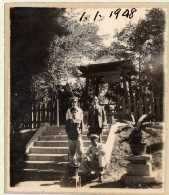
▲1948年於光中亭前合影