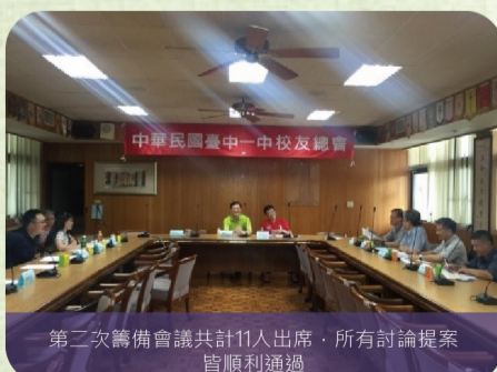
第二次籌備會議共計11人出席，所有討論提案皆順利通過