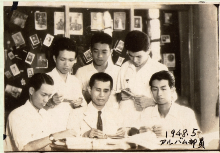
▲1948年江鏡如校友於學校「攝影社」活動時教師指導學員之景象