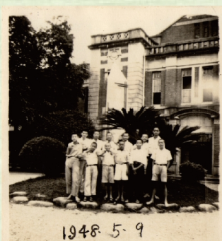
▲1948年與學寮室友於紅樓前合影