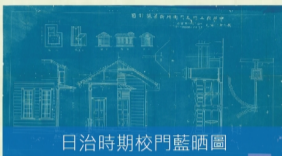
日治時期校門藍晒圖

第一張照片校名明確寫著臺灣公立臺中中學校，這校名的年代應為1915年05月至1919年03月之間。而從1917年至1919年間未有正門動工或竣工的記載，卻有當時正門及門衛所的設計圖，因此推測校門的建置年代最慢應是1917年。