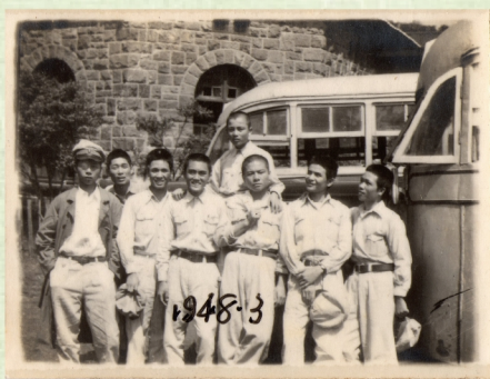
▲1948年與同窗好友於紅樓前合影，可見當時校車的模樣