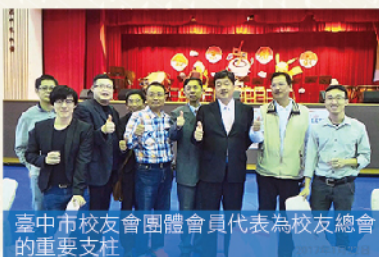
臺中市校友會團體會員代表為校友總會的重要支柱

臺中一中創校至今已逾101年，校史上除了早期霧峰林家捐地建校、成為第一所供臺灣子弟就讀的中學，光復初期被評為績優中學而設立毋負今日碑，1970年代拆除紅樓、學寮等具歷史價值的舊建築，以及近年的校史館（日治時期的講堂）修復計畫與校門新建工程等重大事件之外，傑出校友遍佈社會各界，歷年來已遴選出共計100位傑出校友，涵蓋公職服務、學術研究、企業經營、社會貢獻等各大領域，例如：前副總統吳敦義、臺灣大學前後任校長陳維昭與楊泮池、台達電董事長鄭崇華，以及2016年方辭世的台灣空拍攝影先驅余如季等。2015年，校友們返回母校參加盛大的100周年校慶之時，提議母校得成立全國校友總會，齊八萬名校友之力，回饋母校校務發展，為臺灣的高中教育善盡心力，更藉此讓校友們有根可尋，更加拉近彼此之間的距離。