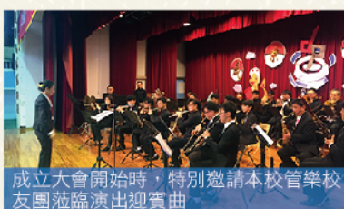
成立大會開始時，特別邀請本校管樂校友團蒞臨演出迎賓曲

臺中一中的校友，在母校自由學風的薰陶之下，個性樂觀進取、處事積極不躁進，一直以來便以培育擁有多元智能之人才聞名於世，除了學業成就表現卓越之外，在學期間對於社團活動的堅持與投入，亦影響了往後的人生旅程。校友總會成立大會當天，母校邀請管樂校友團返校表演迎賓音樂，磅礴的氣勢迴盪在康樂館之中，讓人感到驚艷！管樂社的校友們個個都是社會各領域的菁英，平常利用假日返校練習，並藉此與在校學弟們切磋交流，達到教學相長的目標，也因此與母校之間維持了密切的關係。此外，校友醫師薩克斯風樂團的演出堪稱一絕，這些校友們平日執業甚為繁忙，卻仍能有此雅興確實可貴，亦展現了臺中一中校友多元長才的發展成就。